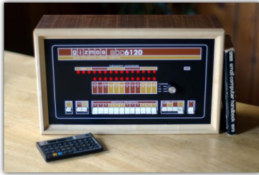
Figure 8: PDP8

principal, ocho registros de 16 bits en vez de los dieciséis registros de 32 bits del 360s original, y un conjunto de instrucciones que era un subconjunto del usado por el resto de la gama.