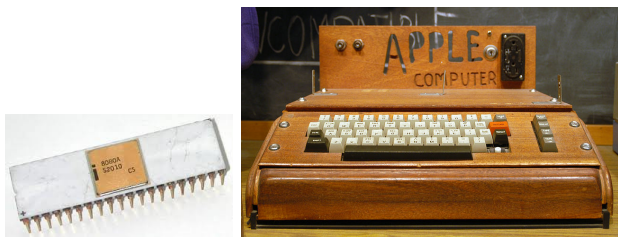
Figure 9: Procesador 8080 y Apple 1