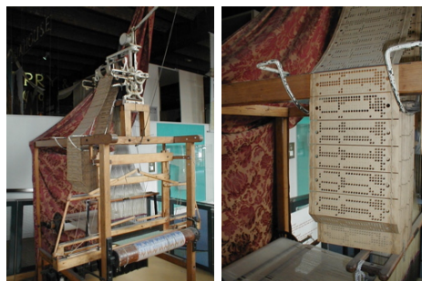
Figura 2: Maquina de Jacquard y tarjetas perforadas