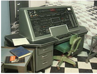
Figura 5: UNIVAC 1