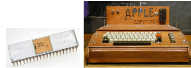
Figura 9: Procesador 8080 y Apple 1

El Intel 8080 fue un microprocesador temprano diseñado y fabricado por Intel. La CPU de 8 bits fue lanzado en abril de 1974. Corría a 2 MHz, y generalmente se le considera