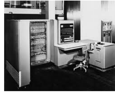
Figura 6: IBM 701

permitían el acceso inmediato a los datos, pero tenían más fiabilidad que las memorias de tubos de rayos catódicos, que son los que se usaban normalmente.