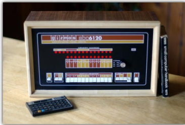
Figura 8: PDP8

El modelo 44 (1966) fue una variante cuyo objetivo era el mercado científico de gama media que tenía un sistema de punto flotante pero un conjunto de instrucciones limitado.