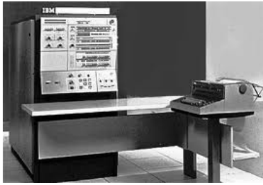
Figura 7: IBM 360