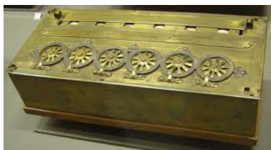
Figura 1: La Pascalina