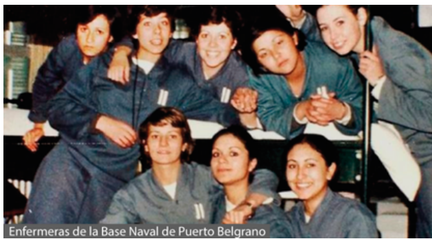
Enfermeras de la Base Naval de Puerto Belgrano